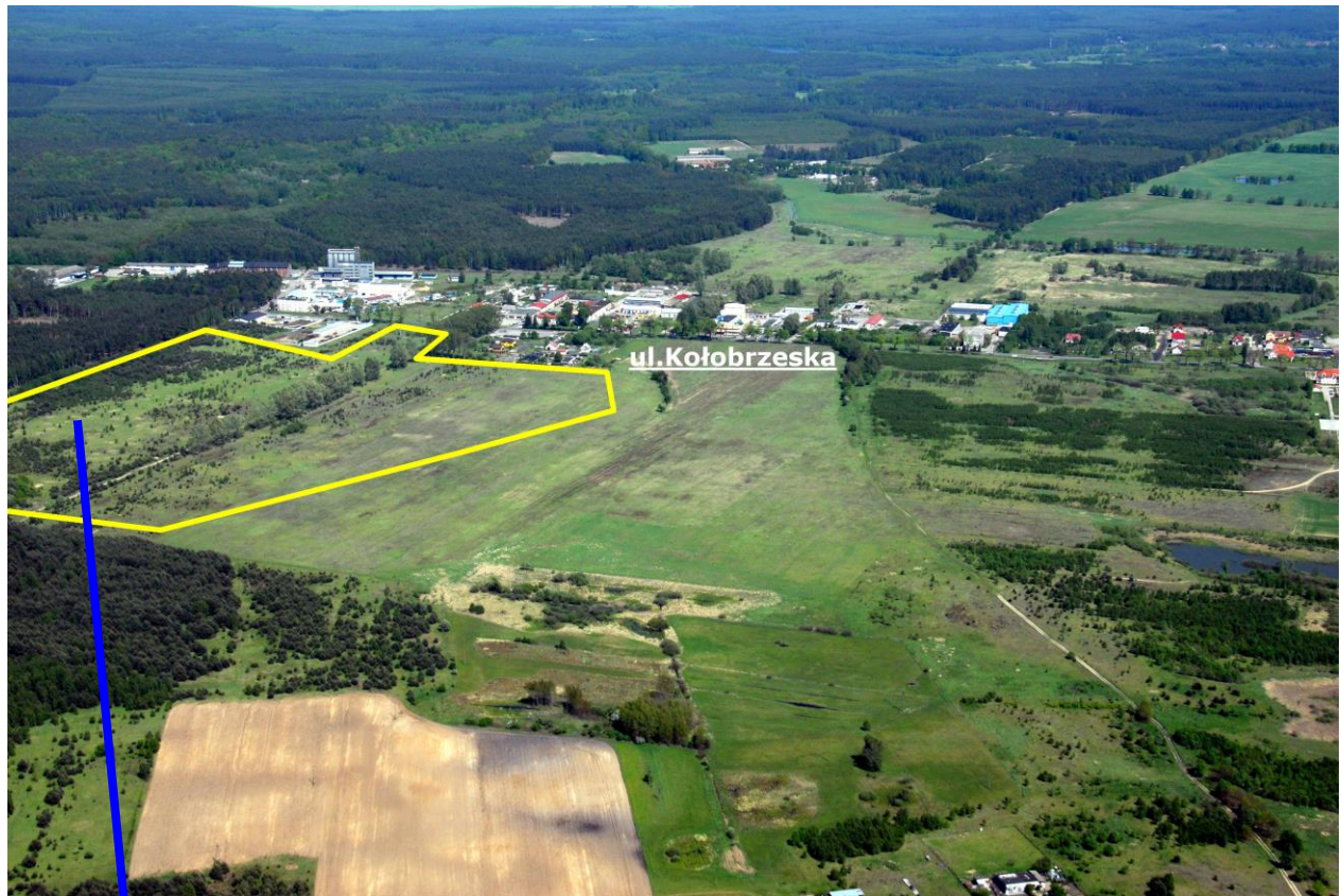
Działka nr 5659/6