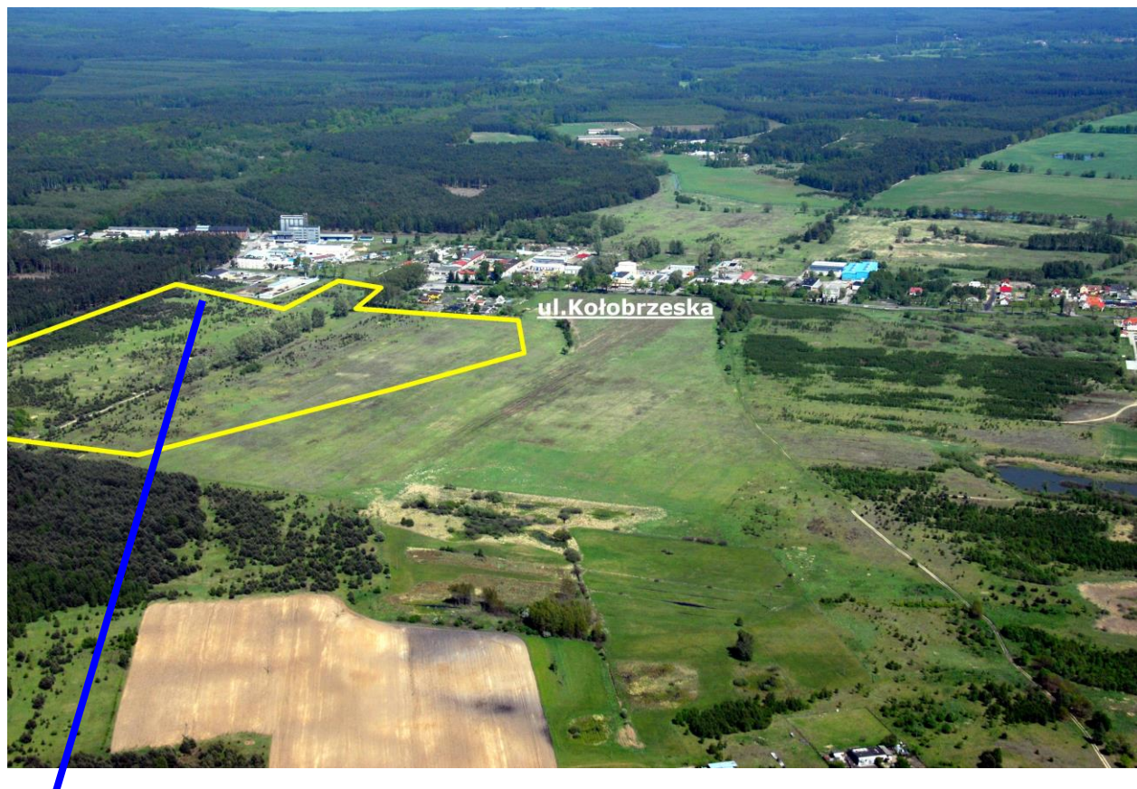
Działka nr 5659/13